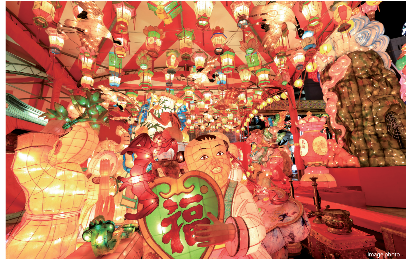
「長崎ランタンフェスティバル」が2024年2月9日(金)～2月25日(日)までの17日間、長崎市内の中心部で開催されます。約15,000個にも及ぶ極彩色のランタン(中国提灯)や、大型オブジェが幻想的に飾られ、街を彩ります。華やかなランタンに彩られた長崎に、ぜひお越しください！