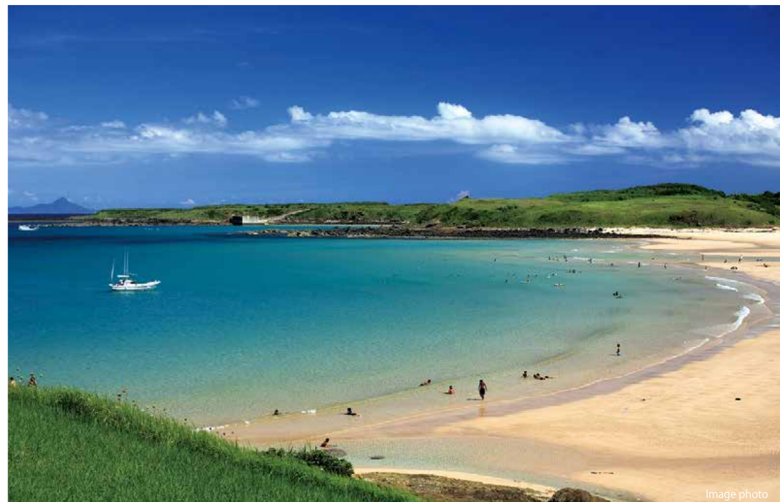
「大浜海水浴場」は西海国立公園内の九十九島にある自然環境豊かな海水浴場。「快水浴場百選」にも選ばれた、美しい白い砂浜とコバルトブルーの海です。沖合には釣りのメッカとして知られる古志岐島が浮かんでいるほか、浜にはキャンプ場も併設されています。