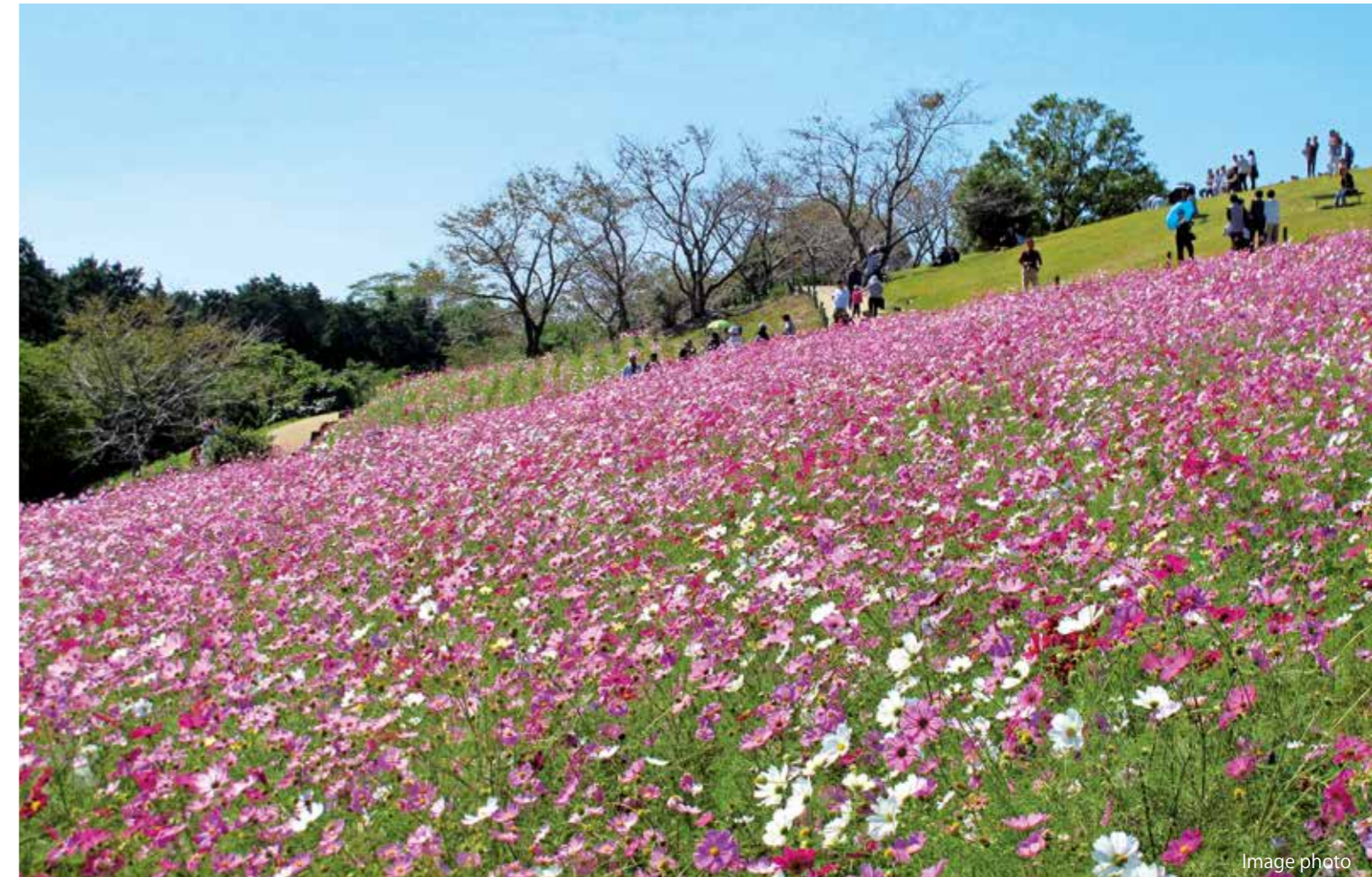
「白木峰高原」は標高1,057mの五家原岳の中腹あたりに位置し、約10,000㎡の丘陵地に、春には10万本の菜の花、秋には20万本のコスモスが色鮮やかに咲き乱れます。その景色の素晴らしさや心地よさを求め、1年を通じて諫早市内外からハイキングや写真撮影などにたくさんの人が訪れます。