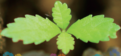
●写真/小楢(どんぐり)の芽吹き